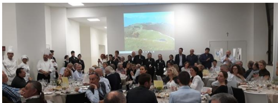
Terza "CENA DIEFFETTO" dell'Istituto Alberghiero DIEFFE di Valdobbadiene.